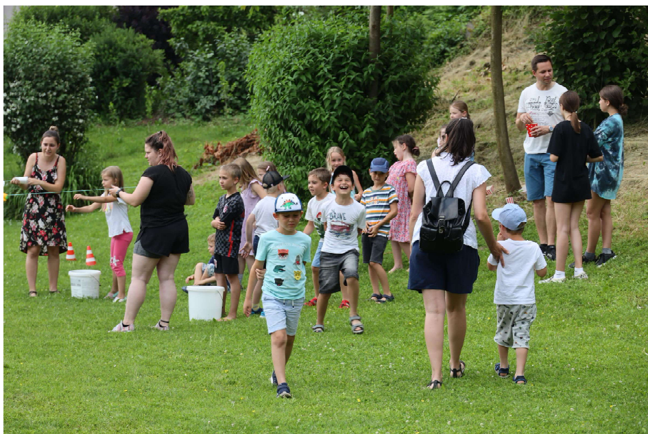
Die Kinder der zweiten Klassen haben bei der letzten Gruppenstunde vor der Sommerpause die Jungschär kennen gelernt.